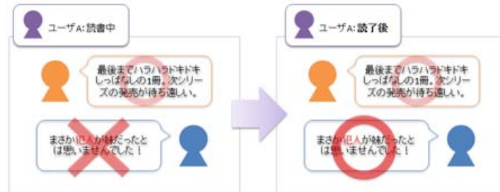
ユーザステータスに合わせて、表示制限

あらかじめサービス事業者が設定したキーワードに対し、ユーザ投稿・レビューの表示可否を制限する。制限はページ単位やユーザごとに設定を変更することも可能となっており、たとえば、検討中・読書中・読了後などのユーザステータスに合わせ、特定のキーワードを含むレビューの表示状態を切り替えることで、読書中のユーザと読了後のユーザへ提供する情報量を変化させることができる。