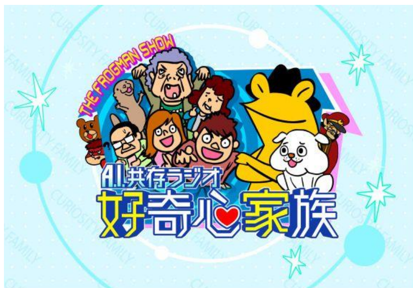
「THE FROGMAN SHOW A.I.共存ラジオ好奇心家族」(イメージ)

その他、10月3日スタートTBSラジオ「THE FROGMAN SHOW A.I.共存ラジオ好奇心家族」のメインキャラクタードッチ君も提供いたします。「AI×ラジオ」の魅力を追求め、新たな価値を提供して参ります。